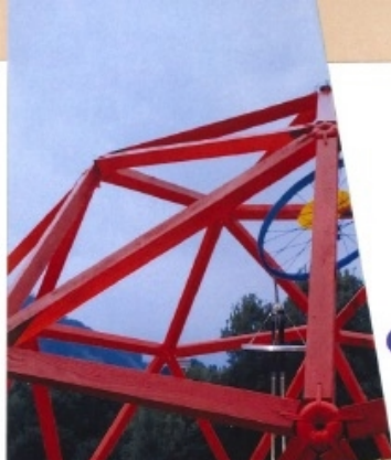
1 Domo PictoMecanismo Arrecifal