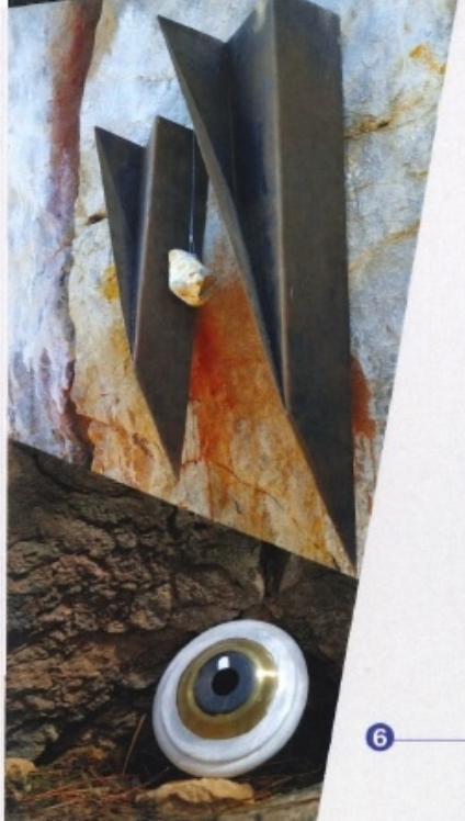
5 Gabinete Sonoro Escuchadores de Otras Eras

El Grito MunchBivalvo · El Arrecifono · Gong de Geranda · Campanas Cavernarias · Baffle Abissal · Bocina del Coral · Octavas Corrugadas · Trémolo Bombardino ·