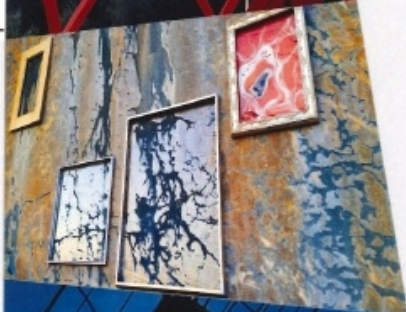
2 Pinacoteca Triásica