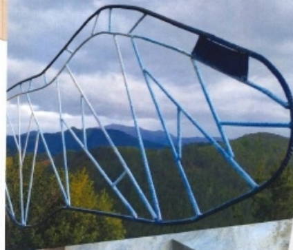
4 Alas Meganeuras