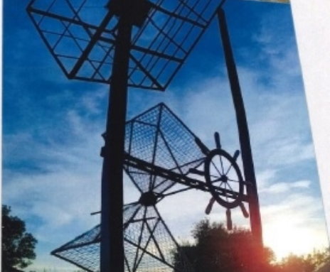
3 Reloj de Eones Cubo Tesseracto